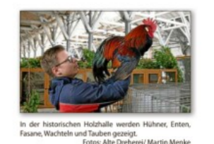
In der historischen Holzhalle werden Hühner, Enten, Fasane, Wachteln und Tauben gezeigt.